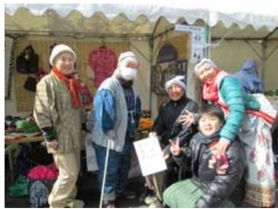
屋外展示 2 飲食・頒布エリア