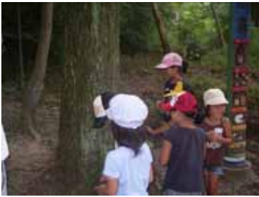
かぶと虫はこの木の根元いるよ

誰でも、いつでも、どんなことでも OK！活動する楽しみを地域の仲間と実感できる。沢山の友達をつくらう！美しい交野の自然が子ども達の未来とともに緑豊かに成長するように、出来る事から頑張っています。