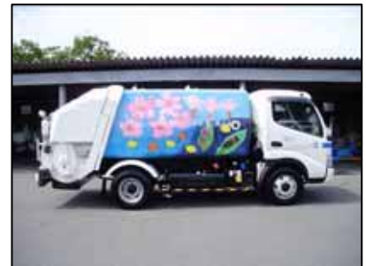
収集作業車（塵芥車）展示