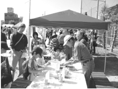
てづくりおもちゃ広場

身近な リサイクル用品を利用した てづくりおもちゃで世代間交流、ディスコン・スカイクロスのニュースポーツで地域の方々とふれあい、マジック・玉すだれ等の演芸で施設等にふれあい訪問。自分の特技を活かして地域で活動しませんか。