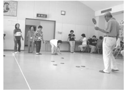
ニュースポーツディスコン