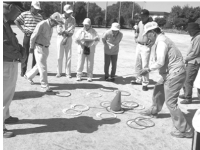
ニュースポーツスカイクロス