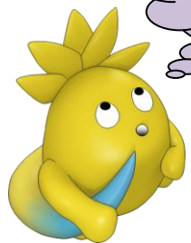
交野市観光キャラクター『星の天満(あまん)』