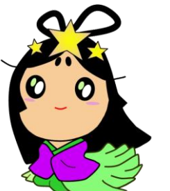
交野市産業PRキャラクター『おりひめちゃん』